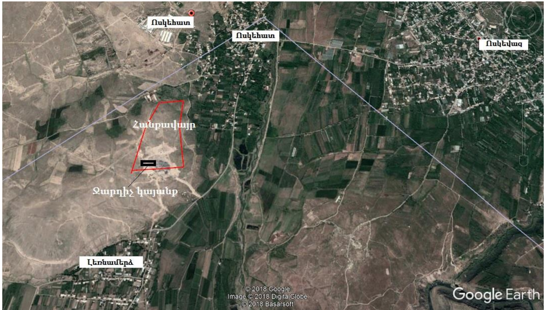
Նկար 2. Տեղանքի իրավիճակային քարտեզ