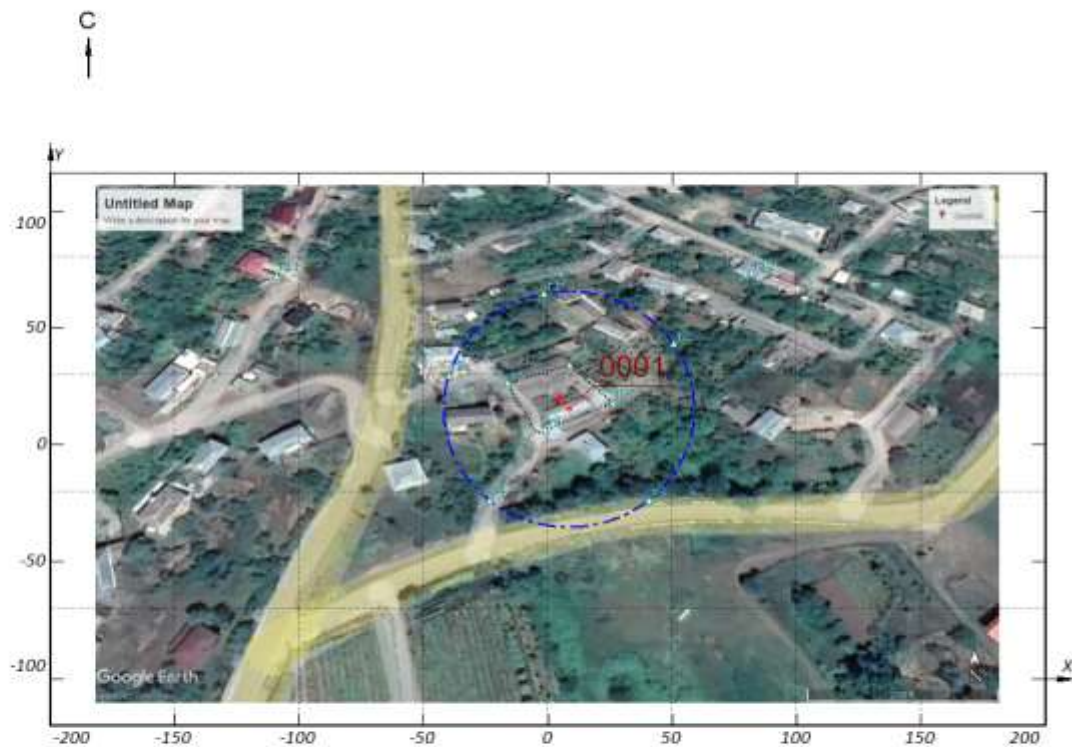
Рисунок 1.4.1 – Вариант № 1; Расчетная площадка №1