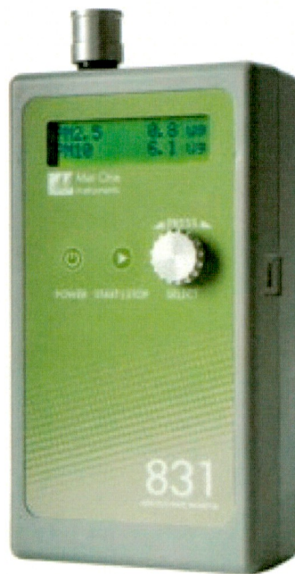
Նկ. 2. Aerocet 831

Մթնոլորտում փոշու մասնիկների չափումներն իրականացվում են կիրառելով Aerocet 831 (նկար 2) սարքավորում, որը չափում է օդում ինչպես PM2.5, այնպես էլ PM10 մասնիկները: Չափումներն իրականացվել են հանքավայրի տարածքում 2 կետից, բանվորական ավանում (կացարանների հարևանությամբ) և հանքավայրի տարածքից դուրս 1 կետից: