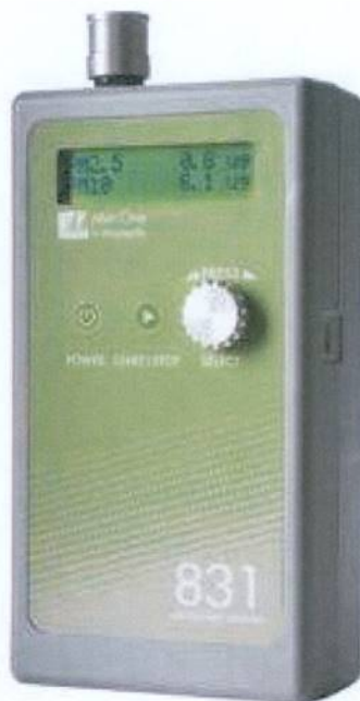
Նկ. 2. Aerocet 831