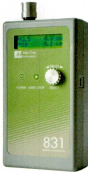
Նկ. 2. Aerocet 831