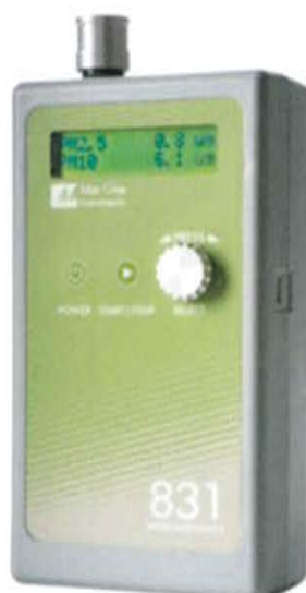
Նկ. 2. Aerocet 831