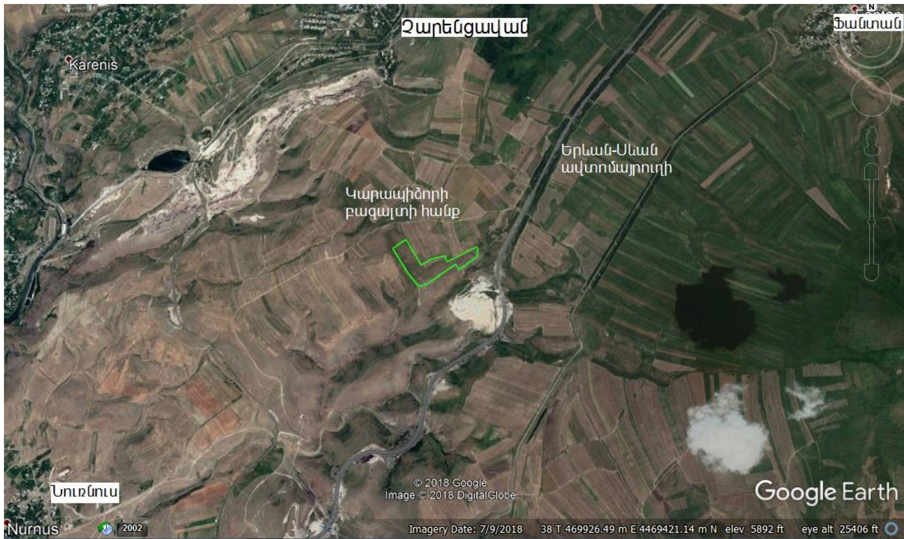
Նկար 2. Տեղանքի իրավիճակային քարտեզ